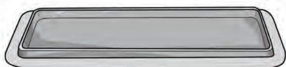
Plateau fabriqué en APET ou PP